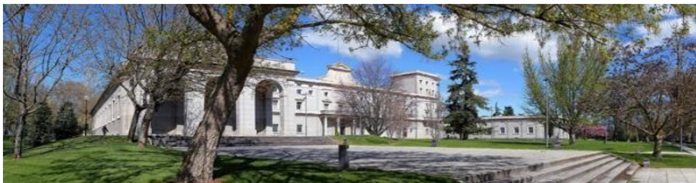
Gmach główny Uniwersytetu Nawarry w Pampelunie

Życzę Fundacji FURCA, by jej praca przynosiła podobne, nawet okazalsze owoce, w postaci gorliwej i różnorodnej posługi polskich kapłanów.